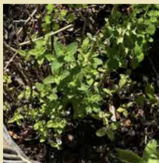
Giv stauderne et Chelsea Chop