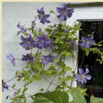
Støtte til klematis